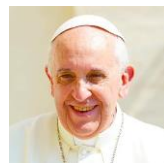
Pape François Twitter du 15 août 2021

Souvenons-nous de ceux qui ne peuvent pas aller en vacances. Je pense spécialement aux malades, aux personnes âgées, aux prisonniers, aux chômeurs, aux réfugiés, et à toutes les personnes seules ou en difficulté. Que Marie étende sur chacun sa protection maternelle.